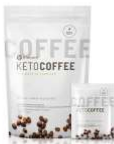
It Works! Keto Coffee