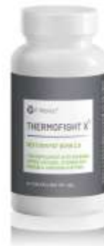
ThermoFight X x