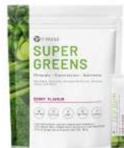
It Works! Super Greens