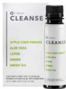
It Works! Cleanse

Pour la St-Valentin ma compagne m'a donc offert un pack It-Works de 4 produits que voici.